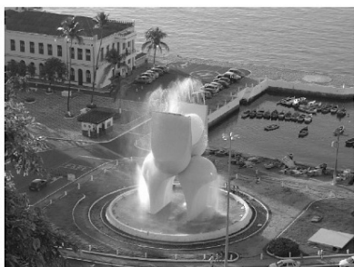
Mario Cravo Júnior, Fonte da Rampa do Mercado (Salvador/Bahia, 1970).