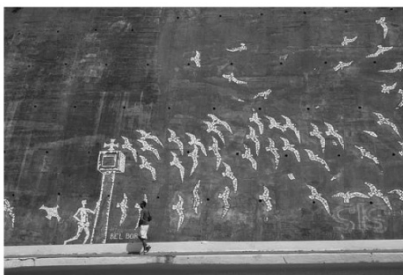
Bel Borba, Mosaicos , Avenida do Contorno (Salvador/Bahia, 1998).