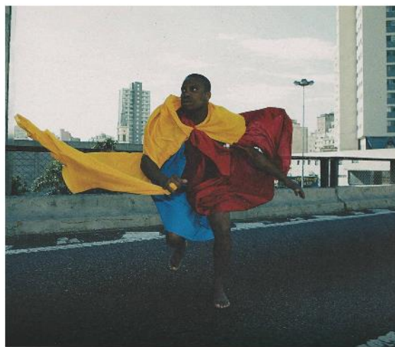
Hélio Oiticica, Parangolês , 1965.

A partir dessas considerações, redija um texto dissertativo sobre “O neoconcretismo brasileiro: além do objeto” . Ao elaborar seu texto, aborde, necessariamente, os aspectos a seguir: