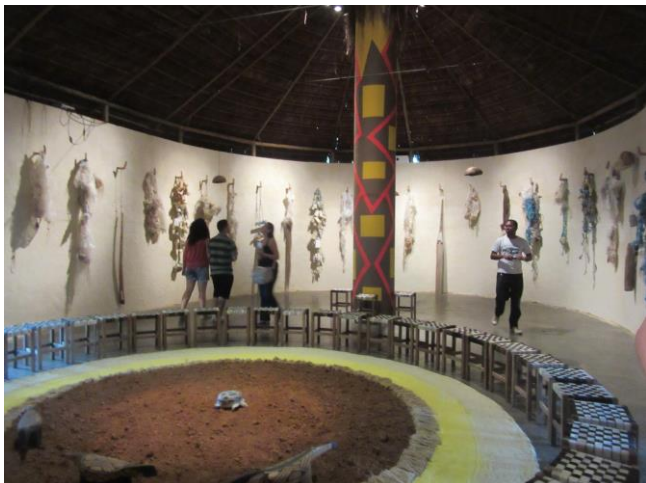
Bené Fonteneles. Ágora: Oca Tapera Terreiro , 2016.

Observe a imagem e leia o trecho a seguir.