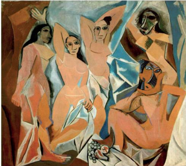
Pablo Picasso, As senhoritas de Avignon (1907).

O docente de Arte elabora um plano de aula para os anos finais do Ensino Fundamental intitulado “Cubismo: uma arte geométrica construtiva”. O objetivo geral é favorecer o contato e a apreensão significativa do Cubismo, enquanto corrente artística e arte planificada, geométrica e construtiva. A primeira etapa da atividade consiste em submeter uma obra cubista de Picasso à apreciação dos alunos.