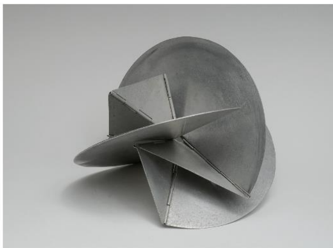
Lygia Clarck, Os bichos , 1960 (escultura em alumínio).

Adaptado de Nereide & Tatiane SCHILARO SANTA ROSA. Arte contemporânea no Brasil . Rio de Janeiro: Ed. Pinakotheke, 2015, p. 11-12.