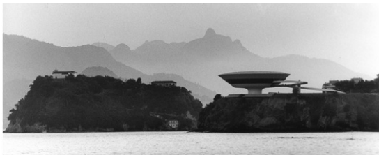
(Painel fotográfico - Museu de Arte Contemporânea (MAC) de Niterói (RJ), projeto de Oscar Niemeyer - Pavilhão do Brasil.

http://www.archdaily.com.br/601258/pavilhao-do-brasil-na-bienal-de-veneza-2014-brasil-modernismo-como-tradicao