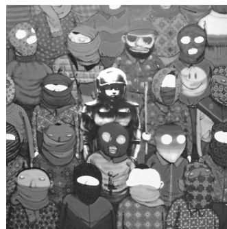
( http://www.thefoxisblack.com/2013/10/21/os-gemeos-teams-up-with-banksy-as-a-part-of-his-ongoing-new-york-residency/ )