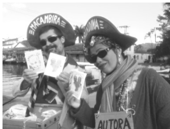
(Casal na FLIP (Festa Literária Internacional de Paraty) mostra o cordel em homenagem aos "imortais".)

A morte é traiçoeira, mas enfim foi enganada. Levou três homens com ela, mas fez uma trapalhada. Pois foram três imortais Eles ganharam a parada.