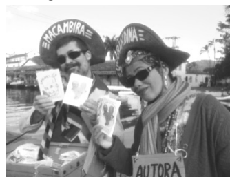
(Casal na FLIP (Festa Literária Internacional de Paraty) mostra o cordel em homenagem aos "imortais".)

A morte é traiçoeira, mas enfim foi enganada. Levou três homens com ela, mas fez uma trapalhada. Pois foram três imortais Eles ganharam a parada.