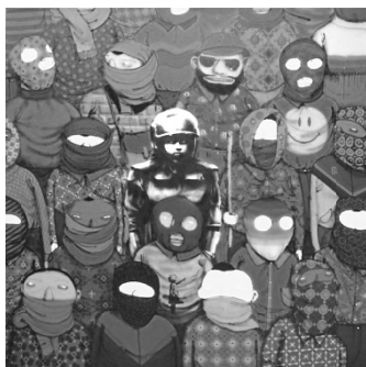
( http://www.thefoxisblack.com/2013/10/21/os-gemeos-teams-up-with-banksy-as-a-part-of-his-ongoing-new-york-residency/ )