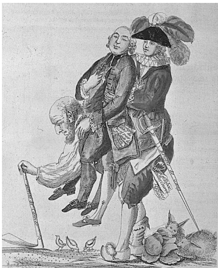
(Gravura impressa e posta em circulação no ano de 1789, Paris, BnF.)

Sobre o contexto social que motivou a revolução de 1789, assinale a opção que interpreta corretamente a sátira política reproduzida acima.