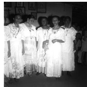
Pierre Verger. Casa de Nagô: Dançantes com Voduns (1948).

Com relação ao Tambor de Mina, com base em seus conhecimentos e nas imagens apresentadas, analise as afirmativas a seguir.