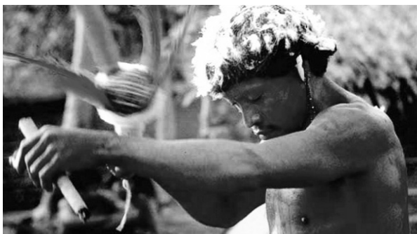
(Eduardo Viveiros de Castro, O pajé Kañi-payé com o aray [chocalho] e o charuto (1982))

As tradições religiosas indígenas são diferentes entre si, mantendo, como um dos traços comuns, a presença do pajé e dos rituais de pajelança.