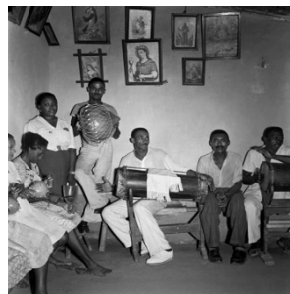
Pierre Verger. Casa de Nagô: Conjunto de músicos com instrumentos característicos (1948).

Pierre Verger foi um fotógrafo e etnógrafo francês radicado na Bahia. Em 1948, em viagem pelo Maranhão, fotografou de perto algumas cerimônias religiosas, como as do Tambor de Mina , reproduzidas a seguir.