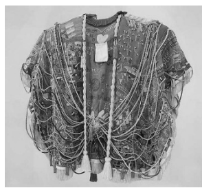
Arthur Bispo do Rosário, Manto da Apresentação , tecido, bordados e cordas, 30 Bienal de São Paulo, 2012.

Com relação à poética de Arthur Bispo do Rosário, com base nas imagens acima, analise as afirmativas a seguir.