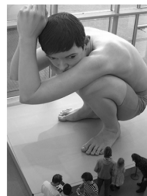
Ron Mueck, Menino agachado , escultura em fibra de vidro de 5 m de altura, 1999.