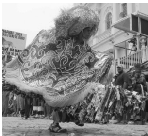
Caboclo de lança, maracatu rural Leão de Ouro, Condado, Pernambuco, 2009.

A identidade cultural brasileira, que se expressa em tradições festivas como a do maracatu, também é objeto de reelaboração artística, como no caso do Manto da Apresentação, de Arthur Bispo do Rosário.