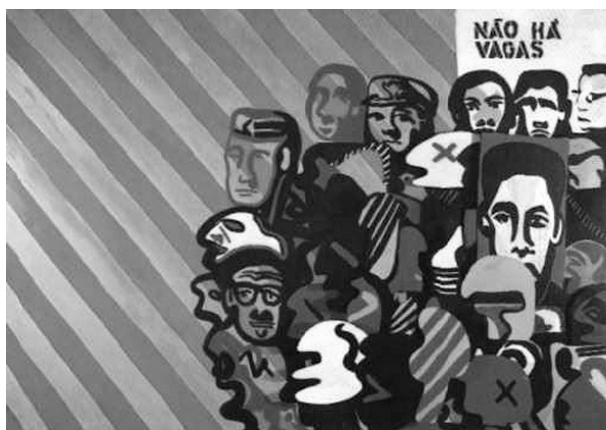
Rubens Gerchman, Não há vagas , relevo em madeira pintada com tinta acrílica, 1965.

As imagens acima exemplificam uma tendência da arte brasileira na década de 1960, em diálogo com a corrente artística internacional conhecida como