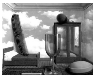
René Magritte, Os valores pessoais , óleo sobre tela, 1952.

As duas obras retratadas a seguir foram produzidas em diferentes épocas e usando diferentes técnicas. Entretanto, ambas se valem da mesma linguagem das artes visuais para provocar os observadores.