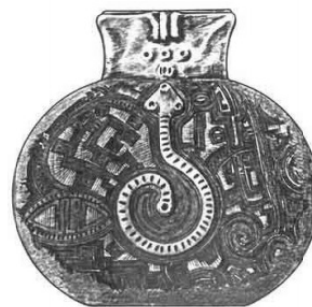
Fig. 1: Vaso com aplique representando cobra, desenho de Tom Wildi.