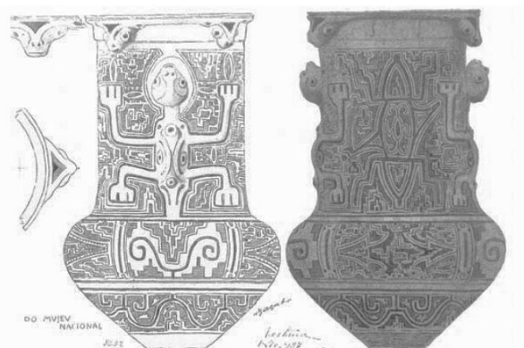
Fig. 2: Urna funerária decorada com apliques modelados na forma de lagartos.

Com base nos exemplos acima de cerâmica marajoara, assinale a opção que caracteriza corretamente a iconografia marajoara.