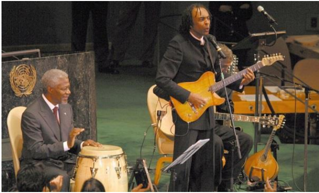
Gilberto Gil sings while then UN secretary general Kofi Annan plays percussion at a September 2003 concert at the UN headquarters honouring those killed by a bomb at a UN office in Baghdad a month earlier.

“As for musicologists,” she adds, “until quite recently they were more interested in analysing musical scores than the actual context in which these were produced and how they were received.” In the 1990s came a cultural shift. Scholars were no longer interested solely in “hard power” – that is, in the balance of powers and in geopolitics – but also in “soft power”, where political issues are resolved by mutual support rather than force. [...]