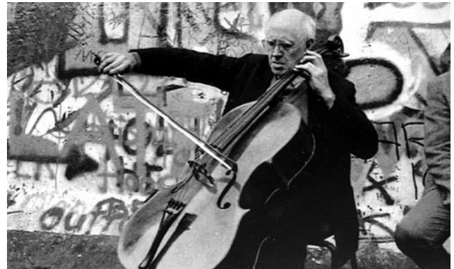
Celebrated cellist Mstislav Rostropovich plays in front of the Berlin wall on 11 November 1989.

Last modified on Tuesday 10 November 2015 13.19 GMT