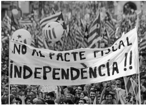
Passeata em Barcelona, em 11 de setembro de 2012, com faixa anunciando “Não ao Pacto Fiscal, Independência!!”