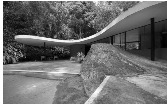
(Texto e imagem extraídos de Casa das Canoas , 1953)

A respeito do projeto para a sua residência, a Casa das Canoas (Rio de Janeiro, 1953), o arquiteto Oscar Niemeyer afirmou: “Minha preocupação foi projetar essa residência com inteira liberdade, adaptando-a aos desníveis do terreno, sem o modificar, fazendo-a em curvas, de forma a permitir que a vegetação nela penetrasse, sem a separação ostensiva da linha reta. E criei para as salas de estar uma zona em sombra, para que a parte envidraçada evitasse cortinas e a casa ficasse transparente como preferia”.