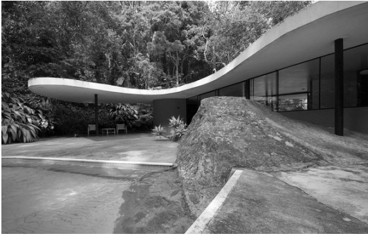
(Texto e imagem extraídos de Casa das Canoas, 1953 )

A respeito do projeto para a sua residência, a Casa das Canoas (Rio de Janeiro, 1953), o arquiteto Oscar Niemeyer afirmou: “ Minha preocupação foi projetar essa residência com inteira liberdade, adaptando-a aos desníveis do terreno, sem o modificar, fazendo-a em curvas, de forma a permitir que a vegetação nela penetrasse, sem a separação ostensiva da linha reta. E criei para as salas de estar uma zona em sombra, para que a parte envidraçada evitasse cortinas e a casa ficasse transparente como preferia ”.