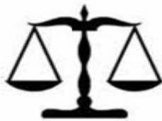
balança de dois pratos

Utilizando uma balança de dois pratos e sem depender da sorte, o número mínimo de pesagens que permite identificar, com certeza, a moeda falsa é: