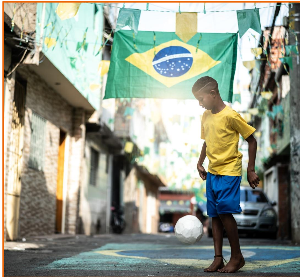
Garoto jogando bola na rua enfeitada para a Copa do Mundo

Hoje vamos conhecer algumas delas e entender como o futebol reflete aspectos sociais, culturais e históricos.