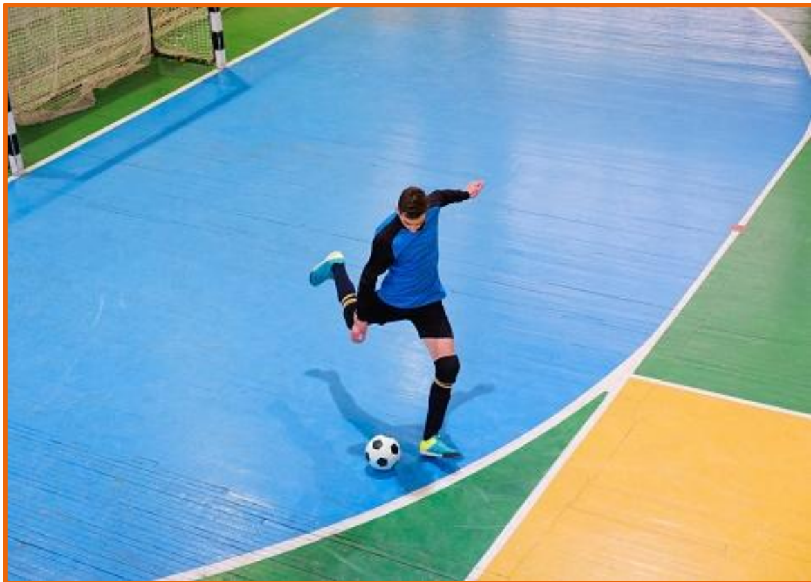
Chute em um jogo de futsal no ginásio