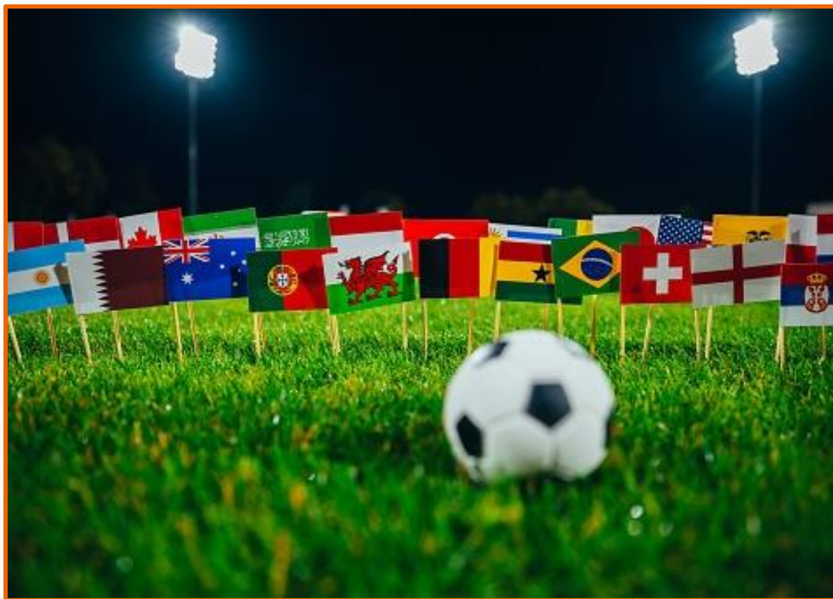
Ilustração das bandeiras de diversos países em um campo de futebol