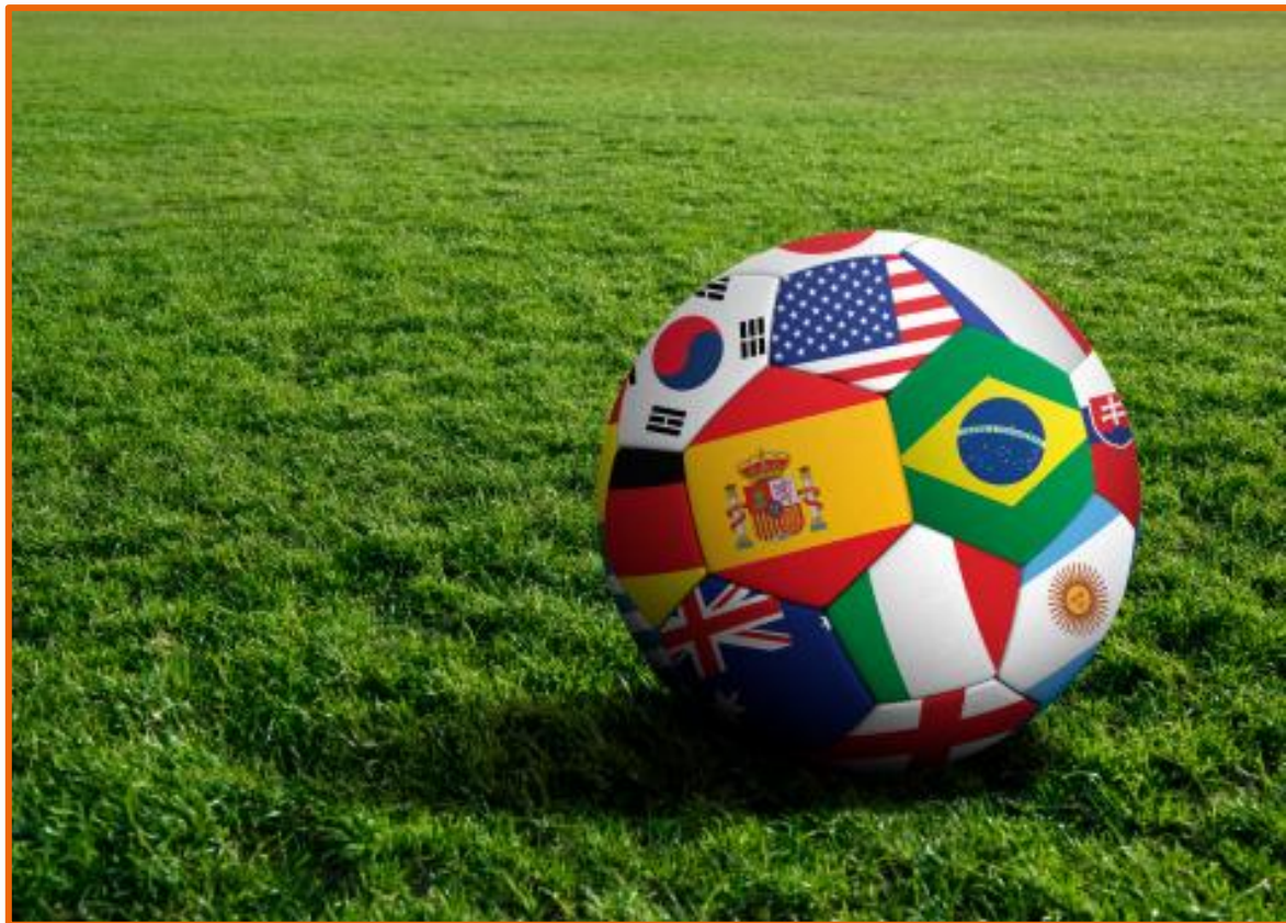
Ilustração das bandeiras de diversos países em uma bola de futebol

Neste ano de 2026, acontecerá a 23ª edição do campeonato mundial da FIFA. Será realizada pela primeira vez em três países: Estados Unidos, Canadá e México , contará com 48 seleções (até 2022 eram 32), ampliando a representatividade de continentes como África e Ásia.