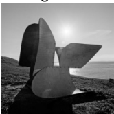
Cruz Latina (Sta Cruz de Cabrália, 2000)