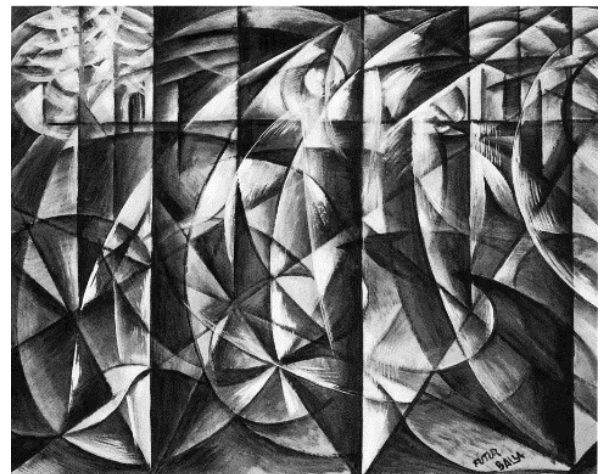
Figura 2: Velocidade de carros e luz (1913), Giacomo Balla

As obras apresentadas pertencem a dois importantes movimentos de vanguarda do início do século XX. A Figura 1 insere-se no Cubismo, enquanto a Figura 2 integra o Futurismo.