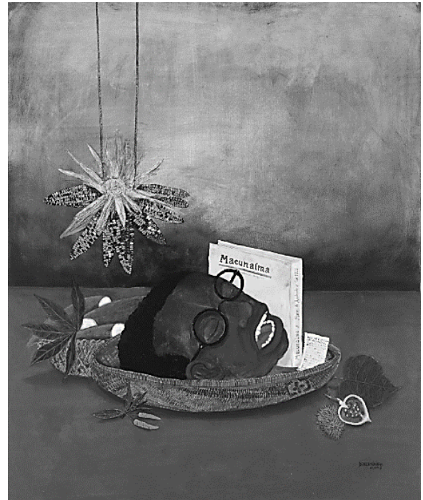
Reantropofagia (2018), Denilson Baniwa

A obra de Denilson Baniwa propõe um diálogo crítico com o modernismo brasileiro dos anos 1920, principalmente com as produções de Mário de Andrade e Oswald de Andrade.