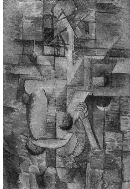
Figura 1: Mulher com um bandolim (1910), Georges Braque