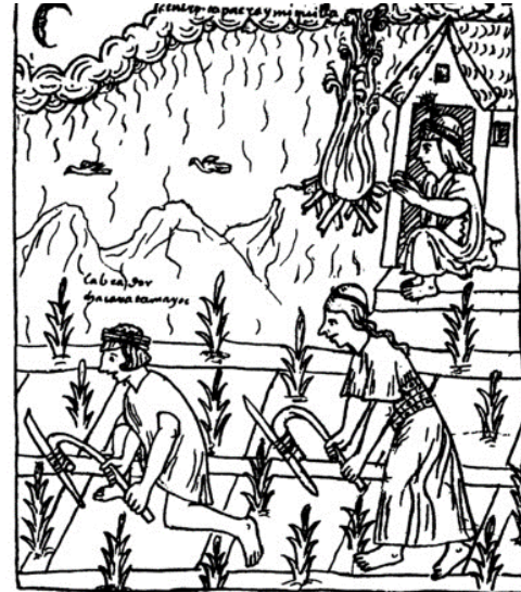
Fonte: GUAMAN Poma de Ayala, Felipe. Nueva crónica y buen gobierno , 1615.

Assinale a opção que descreve corretamente uma política mantida pelos espanhóis após a conquista do território do Império Inca.