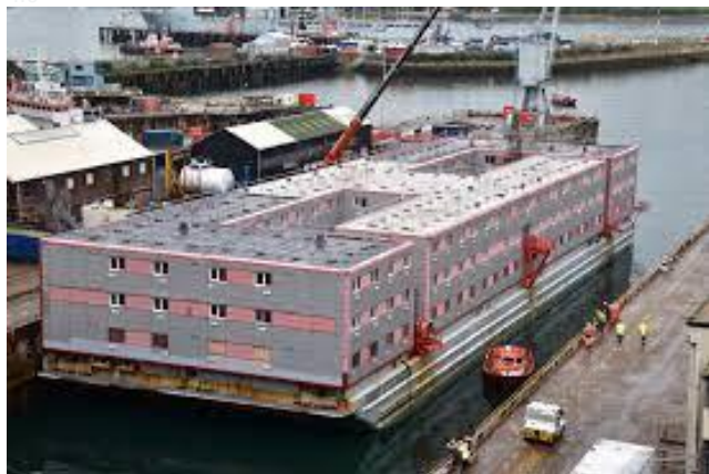
Foto da embarcação Bibby Stockholm , ancorada no porto de Portland no Reino Unido que, no ano de 2023, hospedou os imigrantes que chegaram ao país.