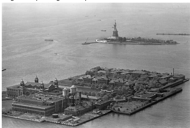
Foto de Ellis Island , ilha em Nova Iorque que recebeu durante os séculos XIX e XX imigrantes que chegavam à cidade. Serviu como lugar para o cumprimento de quarentenas, inspeções médicas e de asilo para imigrantes.

O docente propôs a análise das duas fotos como atividade didática sobre o mundo contemporâneo, tendo os processos migratórios como objeto de estudo.