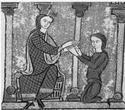
BLOCH, Marc. A Sociedade Feudal . Lisboa: Edições 70, 1982, p.170. Adaptado.

A imagem mostra dois homens frente a frente: um que quer servir e o outro que aceita, ou deseja, ser chefe. O primeiro une as mãos e, assim juntas, coloca-as nas mãos do segundo.