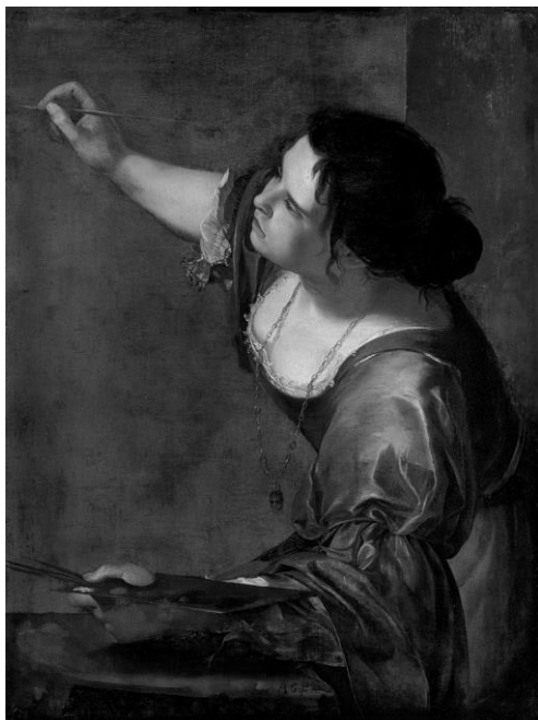
Artemisia Gentileschi (1593–1652/53). Auto Retrato como Alegoria da Pintura , C. 1638-39. Óleo sobre tela - Royal Collection, Windsor, Inglaterra.

O Auto Retrato como Alegoria da Pintura de Artemisia Gentileschi é uma pintura barroca inovadora, em que a artista retrata-se para a posteridade em plena ação, portando pincel e palheta, escolhendo definir sua identidade pela representação da sua arte.