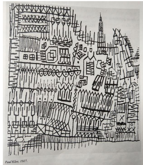
Paul Klee, 1927.

Paul Klee explorou as possibilidades de tempo e espaço, geradoras da forma em suas transmutações. “Diz-se que Ingres organizou o repouso, eu gostaria de, para além do pathos, organizar o movimento” afirmou Klee em sua Teoria da Arte Moderna, anunciando o seu programa estético: criar uma obra que fosse “movimento, gênese contínua, forma em ação”.