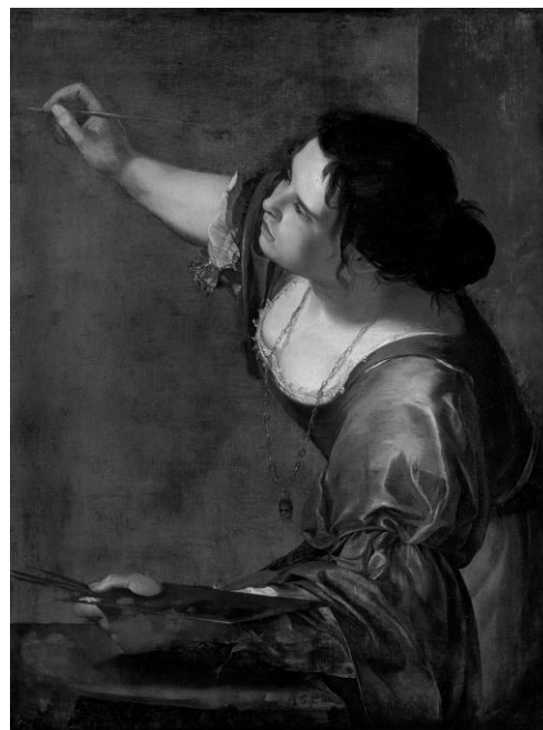
Artemisia Gentileschi (1593–1652/53). Auto Retrato como Alegoria da Pintura , c. 1638-39 Óleo sobre tela - Royal Collection, Windsor, Inglaterra.

O Auto Retrato como Alegoria da Pintura de Artemisia Gentileschi é uma pintura barroca inovadora, em que a artista retrata-se para a posteridade em plena ação, portando pincel e palheta, escolhendo definir sua identidade pela representação da sua arte.