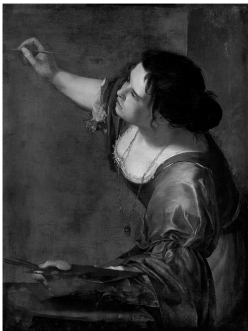
Artemisia Gentileschi (1593–1652/53). Auto Retrato como Alegoria da Pintura , c. 1638-39 Óleo sobre tela - Royal Collection, Windsor, Inglaterra.

O Auto Retrato como Alegoria da Pintura de Artemisia Gentileschi é uma pintura barroca inovadora, em que a artista retrata-se para a posteridade em plena ação, portando pincel e palheta, escolhendo definir sua identidade pela representação da sua arte.