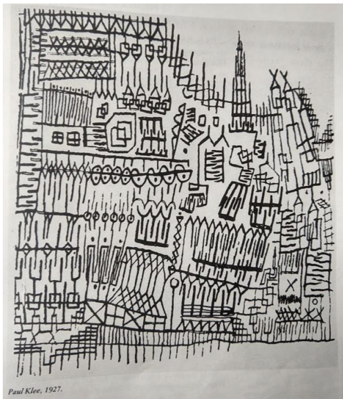
Paul Klee, 1927.

Paul Klee explorou as possibilidades de tempo e espaço, geradoras da forma em suas transmutações. “Diz-se que Ingres organizou o repouso, eu gostaria de, para além do pathos, organizar o movimento” afirmou Klee em sua Teoria da Arte Moderna, anunciando o seu programa estético: criar uma obra que fosse “movimento, gênese contínua, forma em ação”.