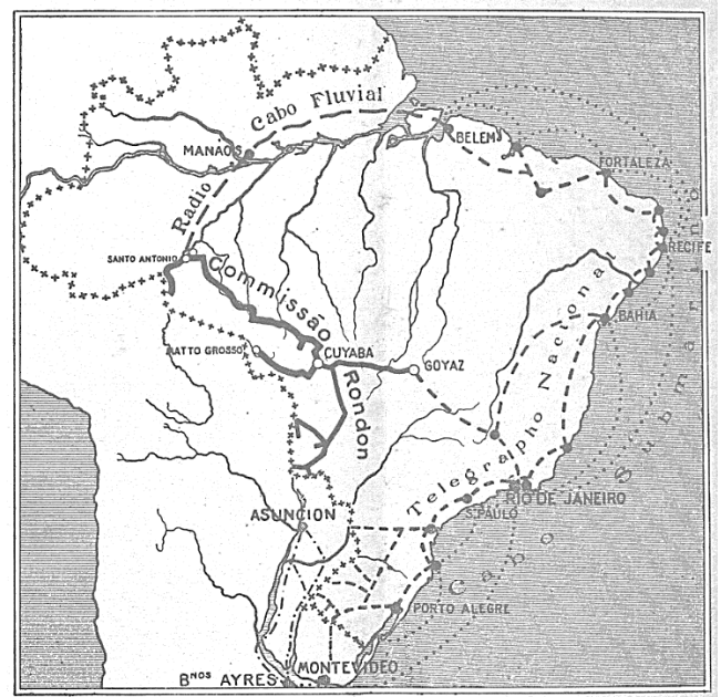
Mapa das linhas telegráficas após os trabalhos da Comissão Rondon.

A imagem apresentada corresponde a um mapa utilizado nas palestras do Coronel Cândido Mariano da Silva Rondon, no qual estava representado o fechamento do circuito de comunicações telegráficas do Brasil, resultado dos trabalhos da Comissão Rondon, no início do século XX.