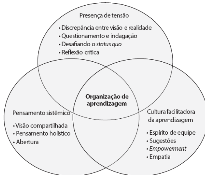
Figura 1 – Características das organizações de aprendizagem