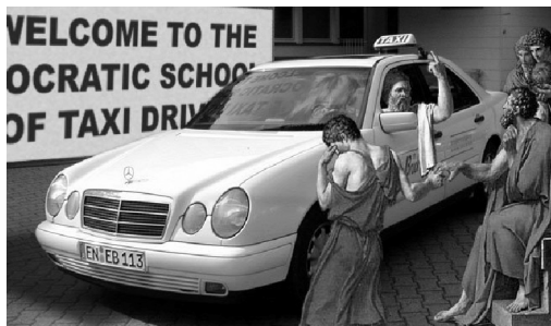
( http://www.filosofia.com.br/figuras/charge/76.jpg )

A imagem acima é uma releitura do quadro “Morte de Sócrates” do pintor francês Jacques-Louis David (1748-1825). A imagem intitula-se “Dirija-te a ti mesmo – a auto-escola sócrática”, e constitui uma maneira bem-humorada de situar a filosofia sócrática, em referência a um de seus lemas fundamentais. Assinale a alternativa que identifica corretamente o lema ao qual a imagem acima se refere.